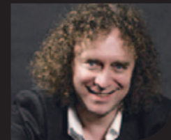
▲〈ピアノ〉 アレクサンドル・ ヴェルシーニン