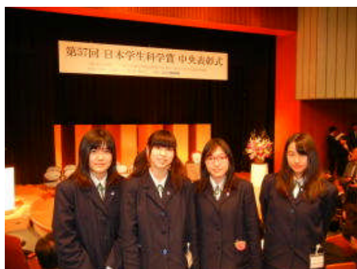
地 学 部