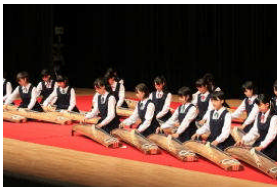
箏 曲 部